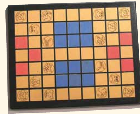
Tablero de juego del dou shou qi, de madera. Páginas 12 y 13.