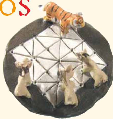
Tablero de juego del bagh chal, conocido como el movimiento del tigre, de arcilla. Páginas 22 y 23.

Podrás construir los tableros con facilidad reproduciendo los dibujos en hojas de papel de color que posteriormente podrás pegar en trozos de cartón. Si el juego te ha gustado y quieres conservarlo, no dudes en plastificarlo. No hagas los tableros demasiado pequeños, porque la manipulación de las fichas sería difícil y el juego perdería su gracia. En general, con una base de unos 30 cm será suficiente.