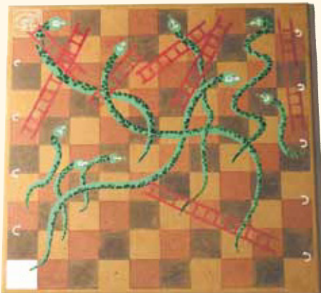
Tablero de juego del moksha patamu, conocido como serpientes y escaleras, de madera. Páginas 26 y 27.