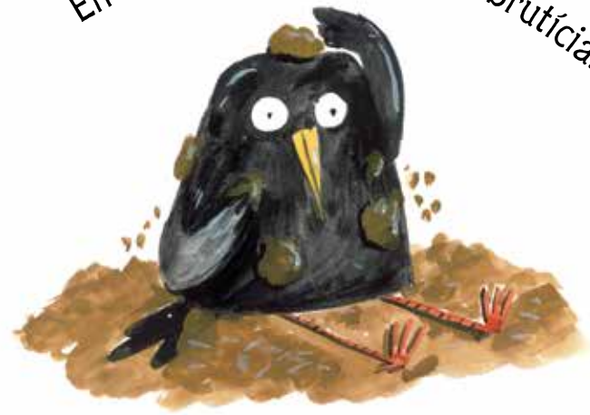
En Climent va descobrir la brutícia.