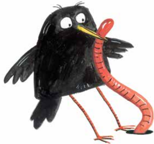
En Carles va descobrir els cucs.