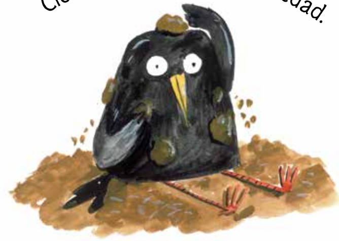
Clemente descubrió la suciedad.