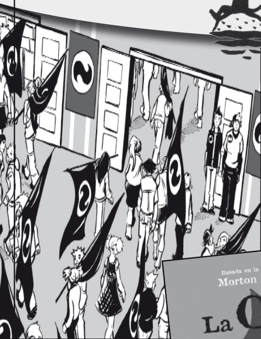
Ilustración: Stefani Kampmann